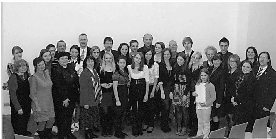
Konkursa Vēstule Gunāram Astram dalībnieki Eiropas Padomes biroja telpās, Rīgā

Konkursam tika iesūtītas 64 esejas. Piecas no tām un mācītāja runa ievietotas šajā rakstu krājumā.